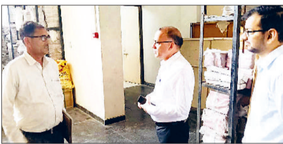
फतेहाबाद। ईवीएम वेयरहाउस का निरीक्षण करते डीसी डॉ. विवेक भारती।

जिला निर्वाचन अधिकारी एवं डीसी डॉ. विवेक भारती ने मंगलवार को ईवीएम वेयरहाउस का निरीक्षण किया। इस दौरान उन्होंने वेयरहाउस के साथ-साथ स्टोर रूम और प्रांगण का भी जायजा लिया लेते हुए सम्बंधित अधिकारियों को ईवीएम सुरक्षा चाक चौबंद रखने के साथ ही हर पहलू की मॉनिटरिंग सुनिश्चित करने के आदेश दिए। निरीक्षण के दौरान डीसी डॉ. भारती ने ईवीएम वेयरहाउस के आसपास साफ-सफाई व्यवस्था को लेकर संबंधित अधिकारियों को दिशा-निर्देश दिए।