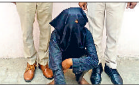
गौतस्करी के आरोप में गिरफ्तार युवक।

टोहाना में पुलिस और गोरखा दल की संयुक्त टीम ने चंडीगढ़ रोड पर मुस्तेदी दिखाते हुए गौ तस्करी के एक बड़े प्रयास को विफल कर दिया है। इस कार्रवाई के दौरान पुलिस ने एक संदिग्ध पिकअप गाड़ी को रुकवाने का प्रयास किया, लेकिन ड्राइवर ने रुकने के बजाय गाड़ी की रफ्तार बढ़ाकर भागने की कोशिश की। इसके बाद पुलिस और गोरखा दल के सदस्यों ने पीछा कर आरोपी ड्राइवर