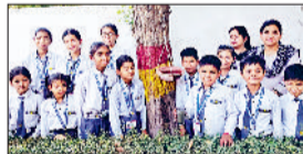
पेड़ों पर सकोरे बांधकर पक्षियों के लिए पानी की व्यवस्था करते हुए विद्यार्थी।

बढ़ती गर्मी और चिलचिलती धूप के बीच शांति निकेतन स्कूल, भूना के विद्यार्थियों ने मानवीय संवेदना की मिसाल पेश करते हुए पक्षियों के लिए पानी की व्यवस्था करने का सराहनीय कदम उठाया। मंगलवार को स्कूल परिसर में विद्यार्थियों और स्टाफ सदस्यों ने मिलकर पेड़ों पर मिट्टी के सकोरे बांधे और उनमें पानी भरकर बेजुबान पक्षियों की प्यास बुझाने का संकल्प लिया। गर्मी के मौसम में जल