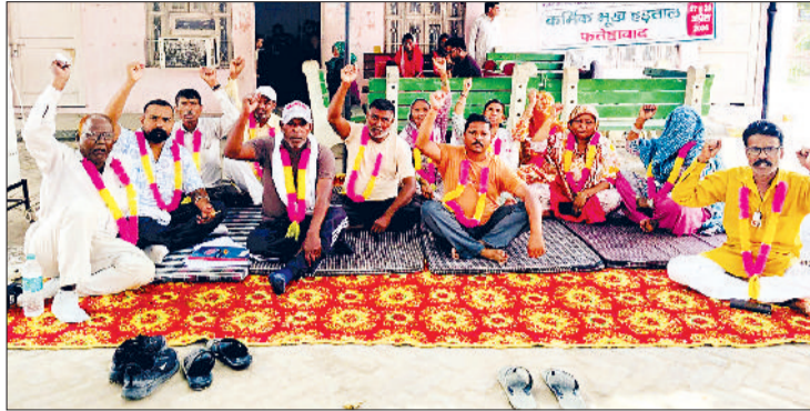
फतेहाबाद। भूख हड़ताल के दौरान नारेबाजी कर रोष जताते नगरपरिषद कर्मचारी।