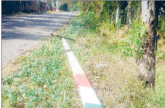
फतेहाबाद। तेज अंधड़ से गिरा बिजली पोल।