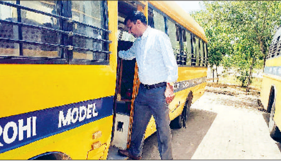
रतिया। आरोही स्कूल जल्लोपुर में स्कूल बस की जांच करते एसडीएम।