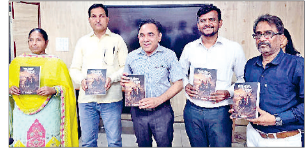
फतेहाबाद। महिला महाविद्यालय में पुस्तक का विमोचन करते अतिथिगण।