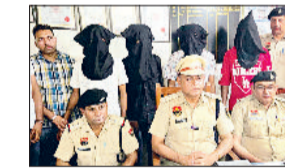
मर्डर केस में गिरफ्तार चारों युवक।