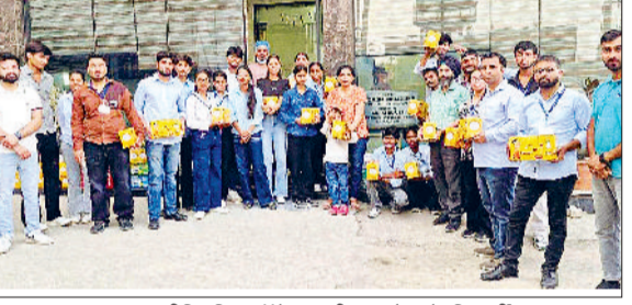
ओढां। भ्रमण पर गए इंजीनियरिंग कॉलेज पनीबालामोटा के विद्यार्थी।

अनुपस्थिति में उनकी जो एक निर्वाचित जनप्रतिनिधि के आधिकारिक कुर्सी पर बैठते हैं, पद का अपमान है।