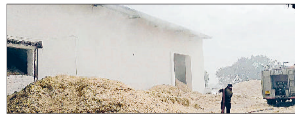
फतेहाबाद। जाखल गोशाला में लगी आग बुझाने दमकल कर्मचारी।

जिले की जाखल मंडी स्थित श्री कृष्ण गोशाला के तूड़ी भंडार में मंगलवार सुबह अचानक भीषण आग लग गई। आग की लपटें इतनी तेज थीं कि देखते ही देखते पूरे गोदाम को अपनी चपेट में ले लिया और आसमान में धुएं का काला गुबार छा गया। इस घटना से गोशाला परिसर और आसपास के क्षेत्र में हड़कंप मच गया। आग बुझाने के लिए स्थानीय दमकल