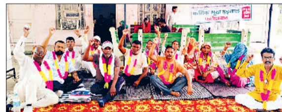
सिरसा। आग से जला गेहूं का भूसा।

क्षेत्र के गांव नाथूसरी कलां में मंगलवार सुबह गेहूं के भूसे में अचानक आग लग गई। हवा के कारण आग तेजी से आगे बढ़ने लगी और देखते ही देखते 20 एकड़ को अपनी चपेट में ले लिया और खेतों में 4 तूड़ी के ढेर जिससे किसानों ने पशुओं के चारे के लिए इकठ्ठा किया था जलकर राख हो गई। आग लगने की सूचना मिलते ही ग्रामीण मौके पर पहुंच गए। ग्रामीणों ने तुरंत इसकी सूचना दमकल विभाग को