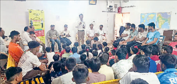
सिरसा। जनगणना को लेकर लोगों को जागरूक करते अधिकारी।