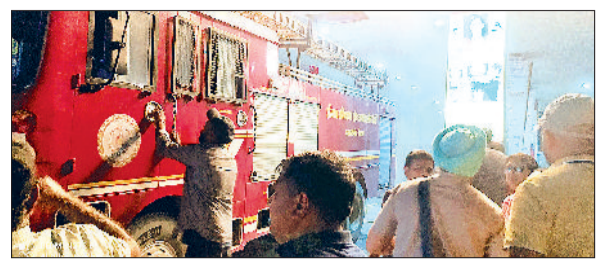
सिरसा। आग बुझाने दमकल कर्मचारी।