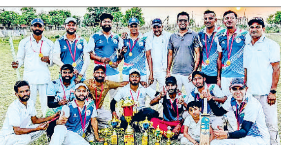
फतेहाबाद। ट्रॉफी में विजेता रही स्वास्थ्य विभाग फतेहाबाद की टीम।

हिसार पुलिस लाइन के खेल मैदान पर खेले गए बेहद रोमांचक और कड़े मुकाबले वाले फाइनल मैच में फतेहाबाद की टीम ने सर्वश्रेष्ठ पैरस को 22 रनों से शिकस्त देकर विजेता ट्रॉफी अपने नाम की। इस