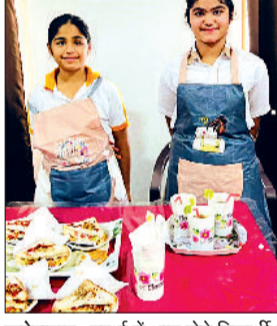
फतेहाबाद। स्पर्धा में भाग लेते विद्यार्थी।

क्रेसंट स्कूल में 'नो फायर कुकिंग प्रतियोगिता' का आयोजन किया गया जिसमें विद्यार्थियों ने बढ़ चढ़कर भाग लिया। बच्चों के बीच आयोजित इस प्रतियोगिता का उद्देश्य न केवल उनकी रचनात्मकता को प्रोत्साहित करना था, बल्कि उन्हें आत्मनिर्भरता और सुरक्षित कुकिंग के महत्व को समझाना भी था। प्रतियोगिता में स्कूल की छठी से दसवीं तक की कक्षाओं के विद्यार्थियों ने बिना आग का उपयोग किए स्वादिष्ट और पोषण युक्त व्यंजन तैयार किए। इन व्यंजनों में बच्चों ने अपनी प्रतिभा और रचनात्मकता का भरपूर प्रदर्शन किया। बच्चों ने मिक्स फ्रूट सलाद,