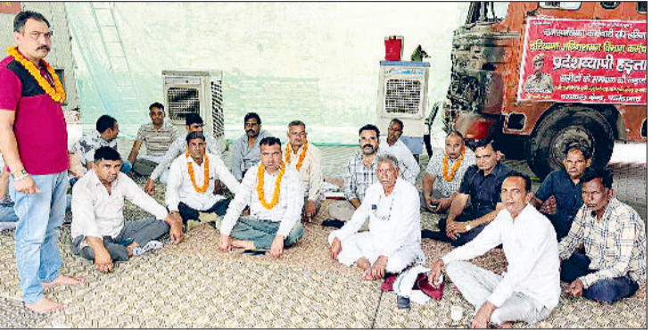
फतेहाबाद। मांगों को लेकर भूख हड़ताल पर बैठे दमकल कर्मचारी।