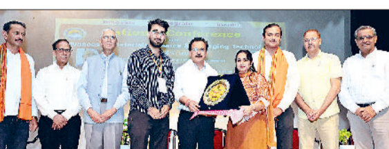
सिरसा। अतिथियों का स्मृति चिह्न भेंट करते कुलपति।